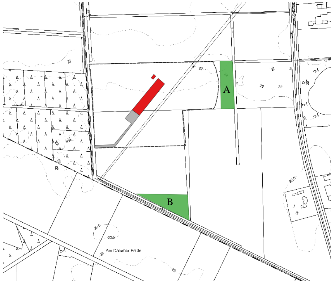
Abbildung 2: Lage der Ausgleichsflächen

Für die Sukzessions-Ackerbrache stehen Fläche A und die Fläche B mit einer Größe von jeweils rd. 0,5 ha zur Verfügung. Es ist geplant, die Sukzessions-Ackerbrache jährlich abwechselnd auf einer der Flächen anzulegen. Die beiden Flächen liegen unmittelbar östlich bzw. südlich der geplanten Anlage (siehe Abb. 2).