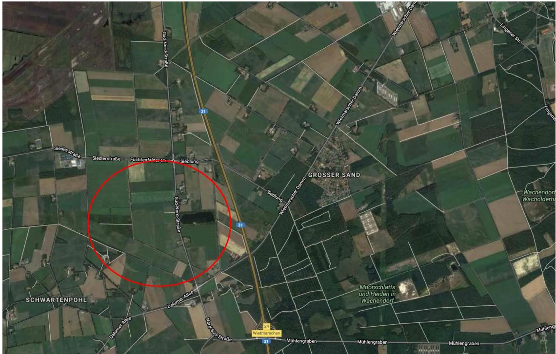
Abbildung 1: Lage des UG im räumlichen Zusammenhang (google maps, Stand: 21.01.2020)