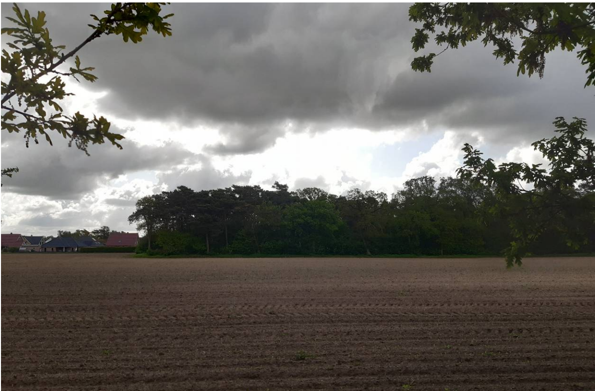
Abbildung 5 Waldstück südlich der Vorhabenfläche