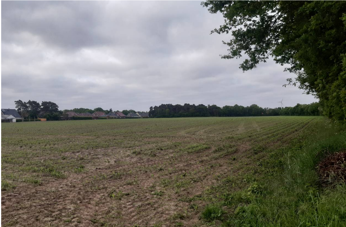
Abbildung 6 Saumstrukturen innerhalb des westlichen Untersuchungsgebiets