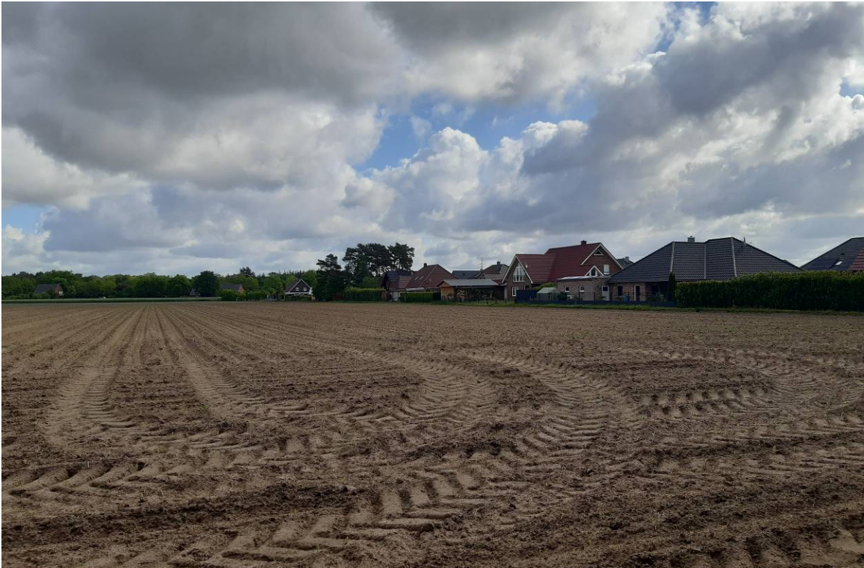
Abbildung 4 Übersicht über die Vorhabenfläche (Flurstück 26/74 der Flur 49)