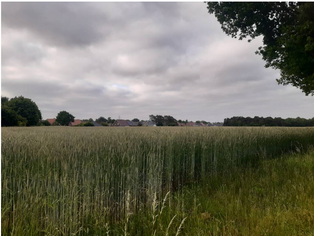
Abbildung 7 Aufgekommene Feldfrucht in der Vorhabenfläche im Frühsommer